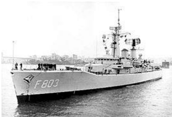
de Van Galen

In het laatste jaar was ik opleider in het Obs gebouw.