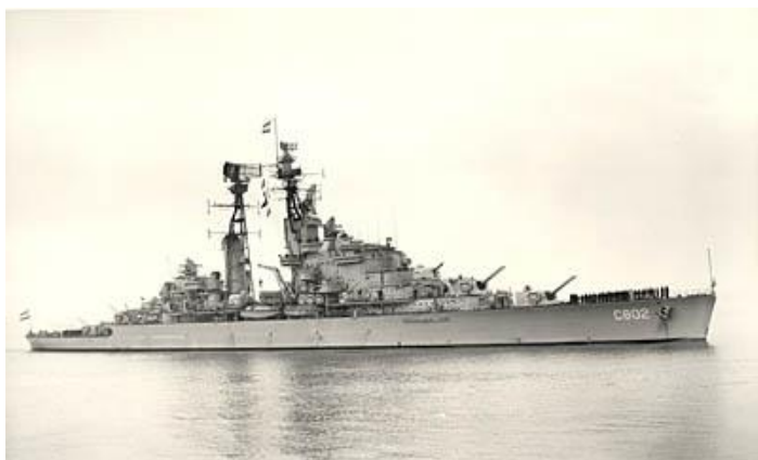
de Zeven Provinciën

17 – 24 jaar Onder Officier Koninklijke Marine