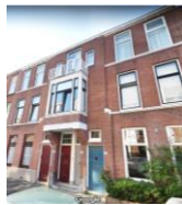
2 e etage