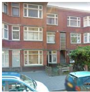
1 ste etage

In de flat te Den Helder heb ik de eerste verbouwing voor ons gedaan. Een poezentrapje vanaf de begane grond naar het eerste balkon. Bleek echter helemaal niet nodig want de kat sprong zo van de grond af tussen de tralie van het balkon. Tevens een salontafel met glasplaat en weekbladenhouder, gemaakt van gebrand vurenhout. In onze slaapkamer kwam het nieuwe bed voorzien van echte Auping spiralen welke zowel hoofd- als voeteneinde in opwaartse stand gezet konden worden. Een ronde grenenhouten tafel met 4 stoelen kwam in de eetkamer en een grote plantenbak maakte de woonkamer compleet.